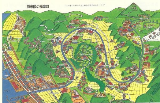
平成 8 年社会科副読本に描かれた「これからの名立町」

合併 20 周年を機にしても“トンネルの向こう”のことばかりでちとつかかりたくなり、70 年前の昭和 30 年(1955 年)には名立村と名立町が合併して“新しい名立町”になったし、30 年前の平成 7 年(1995 年)には「ろばた館」と「椿寿苑」がそれぞれ地域活性化と高齢者福祉推進の拠点としてスタートしたし、10 年前の平成 27 年(2015 年)3 月の北陸新幹線金沢駅延伸に伴い、名立駅はえちごトキめき鉄道に移管され、今も地域の大切な公共交通としてがんばってるし…と、名立にもいろんな歩みがあったんだよ…と言いたくなりますよね。