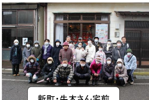
新町・牛木さん宅前

名立大町からスタートしたお雛さま巡りも今年は不動地区まで広がり、14会場18組のお雛さまが早春の名立を彩ってくれました。