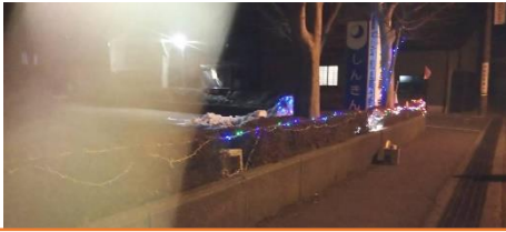
総合事務所前（北部地区振興会）