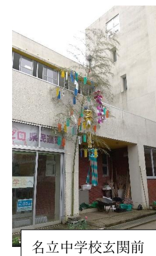
名立中学校玄関前

『悪霊退散を祈り、水神祭りを催し、それに合わせて20発前後の花火が披露』という江戸花火の起源を伝える言説があったようですが、新型コロナウイルス感染拡大の影響で全国各地の花火大会が