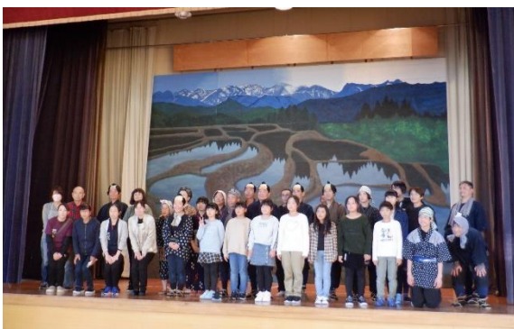
100 年、200 年先の 名立の人々の暮らしのために…

もちろん、どんな時代でも私たちの日々の暮らしを取り囲む社会環境は常に変化していますが、新型コロナウイルス感染のように予期しなかった事象も重なり、今は“明日”の予測がこれまで以上に困難な（＝不確実性な）状況になっていると思います。