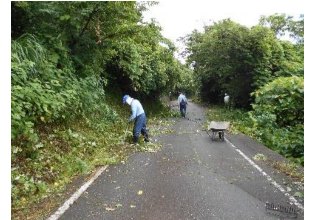
【林道瓜原線草刈作業の様子】