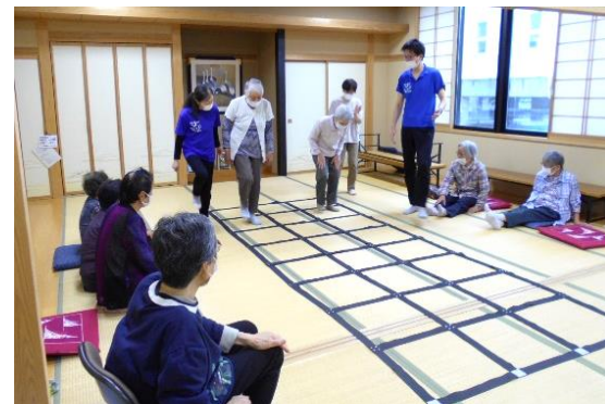
5 月 16 日(日) 横町いきいきサロンで出前サロン

今後も順次各地区のサロンにお伺いしますので、みなさんどうぞお気軽にご参加ください。