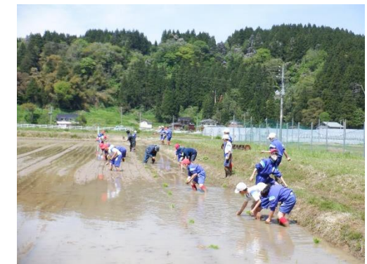
5 月 10 日(月) 宝田小学校 5 年生田植え風景

名立まちづくり協議会はそうした多くのみなさんの願いや思いをしっかり受けとめるとともに、その実現に向け、今年度も各種事業に取り組んでいきますので、今後もみなさんのご理解とご協力をよろしくお願いいたします。